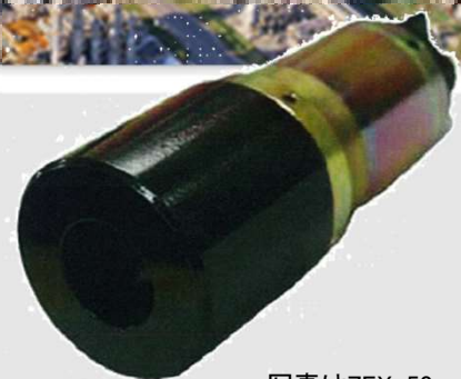
写真はZEX-50 (ZEX-50単体の販売はおこなってません)