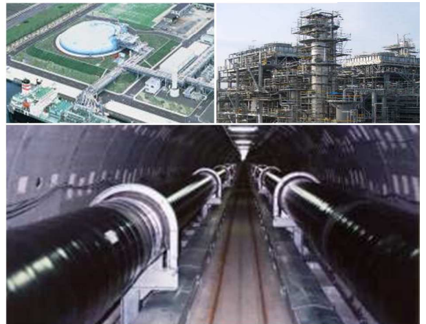
適用が想定される各種プラントエリア

防爆型無線 LAN システムは、ガス、石油化学、化学薬品工場等に存在する防爆エリアへの適用／設置が可能な無線 LAN システムです。防爆型の PDA や IP カメラと組み合わせれば、設備運転データや映像の監視も行う事ができます。さらに、防爆型IP携帯電話との組み合わせにより防爆エリアにて通話が可能となります。指向性／無指向性のアクセスポイントを使い分ける事により、様々なエリア形状に対して最適(ミニマムコスト)なシステムの構築が可能です。