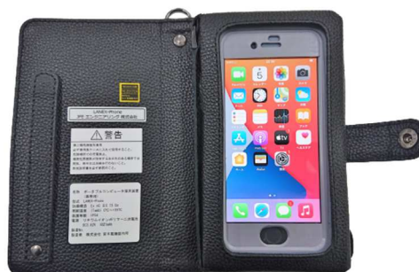
革ケースを開いた状態