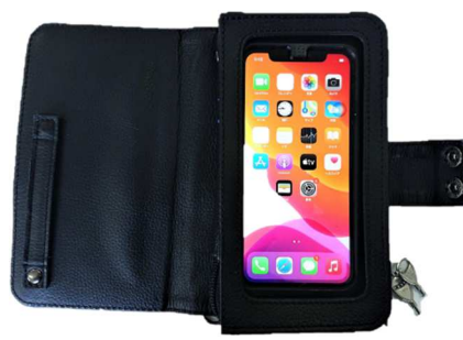
革ケースを開いた状態