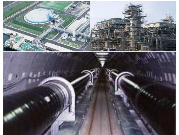
適用が想定される各種プラントエリア

防爆型無線 LAN システム は、ガス、石油化学、化学薬品工場等に存在する防爆エリアへの適用／設置が可能な無線 LAN システムです。防爆型の PDA や IP カメラと組み合わせれば、設備運転データや映像の監視も行う事ができます。さらに、防爆型IP携帯電話との組み合わせにより防爆エリアにて通話が可能となります。指向性／無指向性のアクセスポイントを使い分ける事により、様々なエリア形状に対して最適(ミニマムコスト)なシステムの構築が可能です。